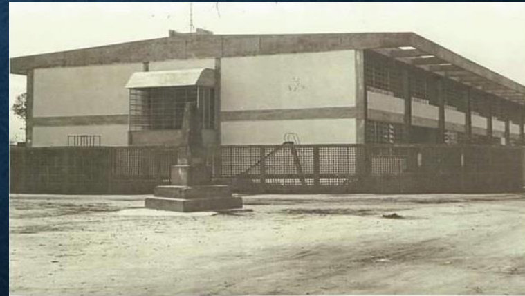
• 1970 – Construção